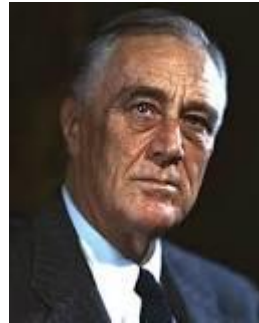
Franklin D. Roosevelt